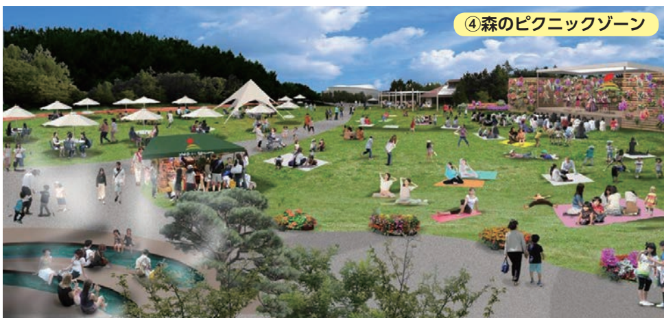
④森のピクニックゾーン