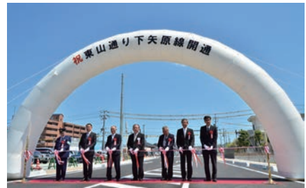
【写真3】都市計画道路東山通り下矢原線の開通式