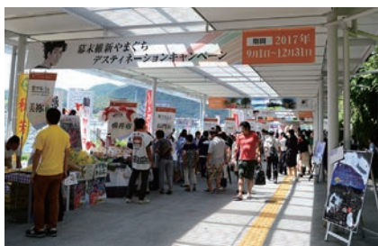
【写真5】 DCオープニングイベントでにぎわう新山口駅南北自由通路