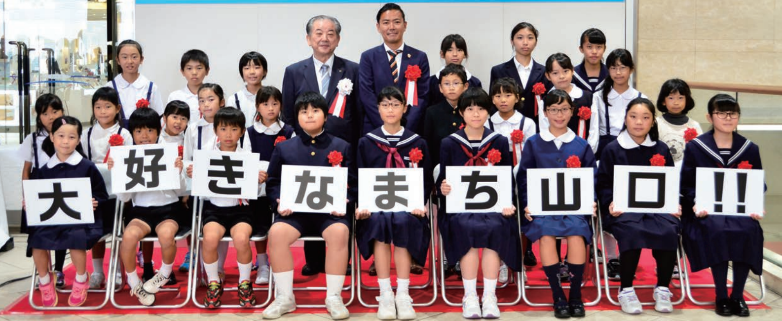
10月14日に行った入賞者の皆さんの表彰式