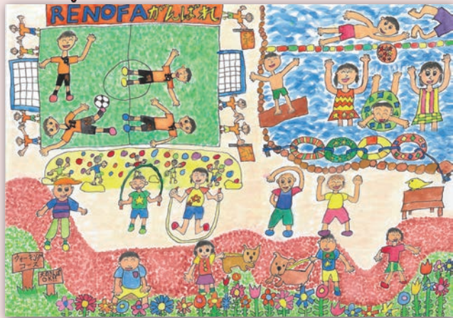
「うんどう大好き 山口市」