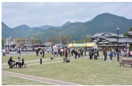
【写真2】 歴史巡りの庭と、多目的広場が整備された山口市菜香亭

皆さんにとって、今年はどうな一年だったでしょうか。本市では、山口・小郡両都市核、21地域の個性や特長を際立たせ、両都市間や各地域との対流を促すための、県都としての都市づくりが大きく進みました。また、平成30年度から39年度までの10年間の山口市全体の計画となる「第二次山口市総合計画」や「第二次行政改革大綱」の策定を進めるなど、創造と改革へのチャレンジに取り組んでいます。