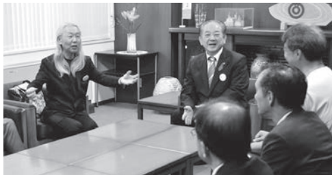
假屋崎氏と歓談する市長ら

10月5日、華道家の假屋崎省吾氏が、「第35回全国都市緑化やまぐちフェア」（愛称山口ゆめ花博）の事前プログラム「山口ゆめ花博 花育ワークショップ」の出席に合わせ、市長を表敬訪問されました。