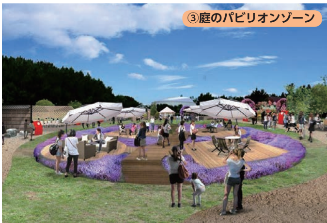
③庭のパビリオンゾーン

造園会社や農業高校等による庭づくりの提案や、来場者が自らの庭づくりに生かせるヒントなどを紹介します。また、お茶を飲みながらくつろぐ庭、暮らしを彩る新しい庭が体験できるゾーンです。