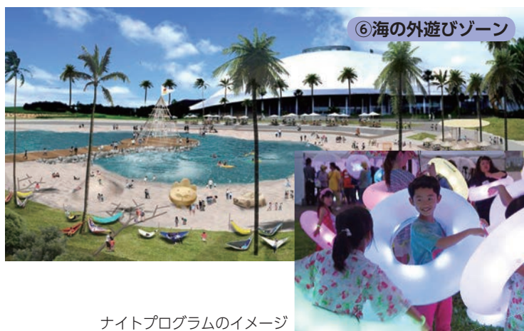
ナイトプログラムのイメージ