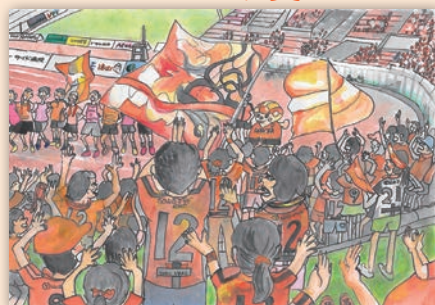
「レノファ J1 めざして みんなで応援!!」