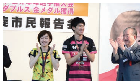
【写真4】 48年ぶりの快挙を遂げた本市ゆかりの石川佳純選手と吉村真晴選手

7月 ■ 幕末維新がわかる本「山口市版」を発売（1日） ■ 九州北部豪雨への災害派遣開始（6日） ■ 厚生労働省山口労働局と就業支援の強化を図る山口市雇用対策協定を締結（7日） ■ 吉村真晴選手・石川佳純選手「金メダルおめでとう」凱旋市民報告会を開催（15日） 【写真4】 角一化成株式会社が鋳銭司団地内の事業所増設を決定（18日）