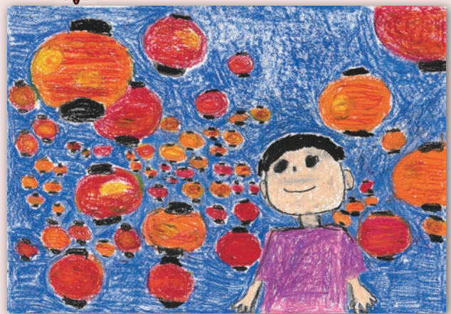
「山口のちょうちん祭」