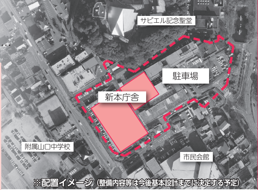
※配置イメージ (整備内容等は今後基本設計までに決定する予定)

「山口市新本庁舎整備基本方針(案)」を作成しました。基本方針は、検討委員会の答申や本市全体の発展につながる本市のまちづくり、1市4町合併協定書における新市の位置に関する附帯決議を踏まえるとともに、周辺への影響や、来庁者の安全性・利便性、総事業費等の観点から総合的に検討を行い、新本庁舎整備に関する基本的な考え方、方向性を示したものです。 この基本方針案について、市民の皆さんのご意見を募集(パブリックコメント)します。