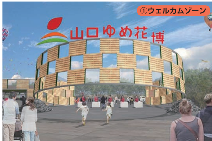
①ウェルカムゾーン