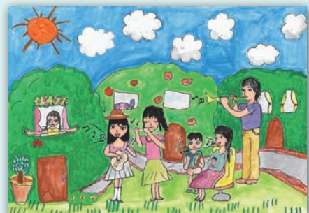
「自然と音楽のまち-やまぐち-」