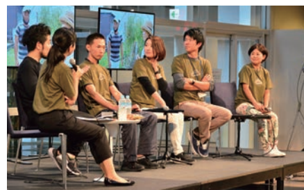
【写真6】移住者の目線で本市の魅力について話す地域おこし協力隊等

豪ストレイドッグス×中原中也記念館スタンプラリーin湯田温泉を開催(4日) ■芦森工業株式会社が山口テクノパークに新事業所建設を決定(5日) ■道の駅「長門峡」開業20周年記念式典を開催(7日) ■第二次山口市総合計画に係る「大好きなまち山口絵画コンクール」で小中学生29人を表彰(14日) ■地域おこし協力隊フェス「みんなのチキオコシ」を初開催(21日) 【写真6】